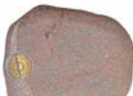
Granittype: Multicolor, brændt