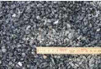
Sort 5-8 mm