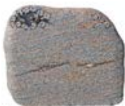
Granittype: Halmstad, brændt