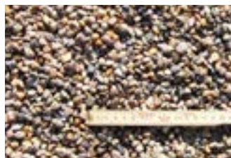
Søsten Gul/okker 4-8 mm