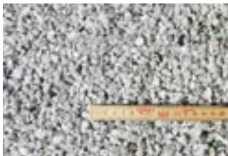
Hvid marmor 5-8 mm