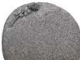
Granittype: Blå Rønne, brændt