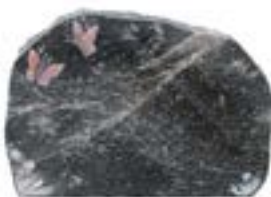
Granittype: Paradis, poleret