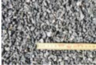
Gråmix 4-8 mm