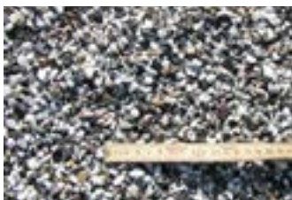
Søsten Sort/hvid 4-8 mm