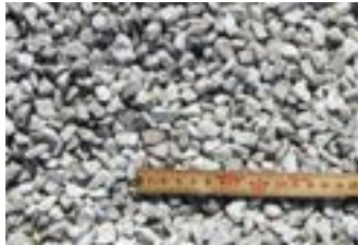
Hvidmix 8-11 mm