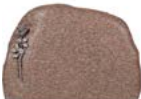
Granittype: Vånga, brændt