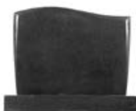
Granittype: Sort, poleret