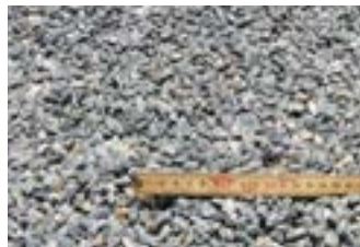
Stenungssund 5-8 mm