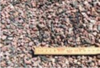
Rødmix 4-8 mm