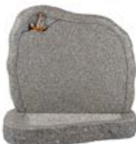
Granittype: Blå Rønne, brændt