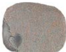
Granittype: Halmstad, brændt