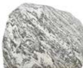
Granittype: Flodsten, tumbiet